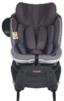
izi ® Turn i-Size