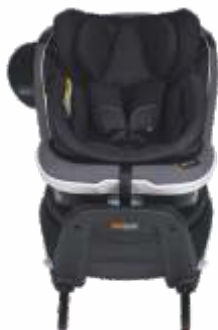
izi ® Twist i-Size